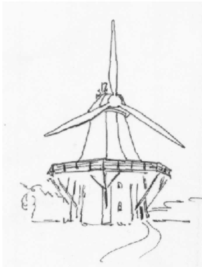
Der Müller hätte das auch so gemacht...

Zu 2. kann man eventuell akzeptieren, wenn nun wirklich und ohne Ausrede kein Geld für 1. vorhanden ist, denn jeder Erhalt ist immer besser, als ein Totalverlust eines Denkmals. Manchmal werden nicht nachvollziehbare Modernisierungen vorgenommen, als Argument wird vorgebracht: Die Müller haben immer modernisiert, das hätte der Müller heute auch so gemacht. Dann würde heute die Mühlenrestaurierung so aussehen, wie auf meiner kleinen, provokanten Gedankenskizze.