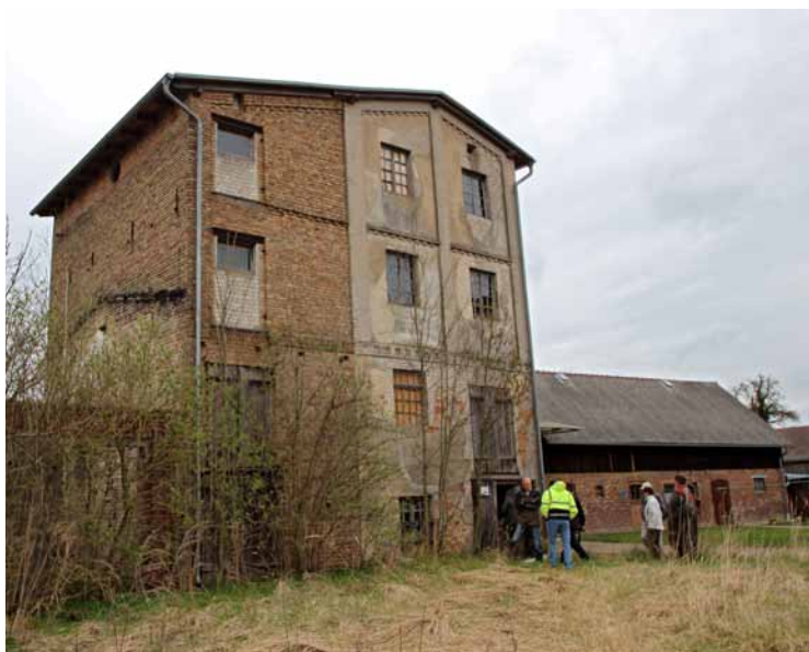
Die Motormühle in Greiffenberg

Das Protokoll der Mitgliederversammlung, veröffentlicht in den Mühlen- nachrichten aus dem Jahre 2012, wird angenommen. Die Abstimmung erfolgt ohne Gegenstimmen und Enthaltungen.