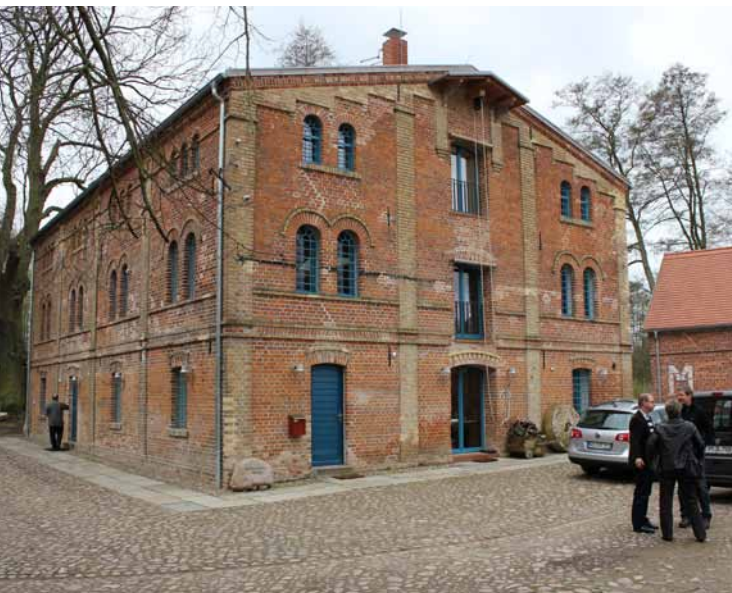
Auf dem Mühlenhof der Breিতেicher Mühle

Der Vorsitzende Stephan Theilig stellt die Beschlussfähigkeit fest, verliest im Anschluss die Tagesordnung und erläutert diese. Der TOP 5 kann nicht wie geplant stattfinden, da beide Kassenprüfer aus persönlichen Gründen nicht anwesend sind. Ein Bericht der Kassenprüfer liegt jedoch vor. Tagesordnungspunkt 9 wird ersatzlos gestrichen, da kein Vertreter der DGM anwesend