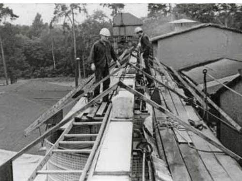
Silobau in Luckau 1965

Mühle finden würde, an der es sich wieder drehen könne. Das Flügelkreuz ist nun bei seinem Sohn in Luckau eingelagert, der sich auch um die vielen anderen noch vorhandenen Teile, die Werkstatt und die umfangreiche Literatur kümmert und diese erhält. Volker Nagel, der mit seinen von ihm betriebenen modernen Wind“mühlen“ die Tradition der Nutzung der Windkraft weiterführt, möchte so das Andenken an seinen Vater bewahren und steht für Interessierte gern zur Verfügung. Vielleicht können die Getriebe oder Lagerböcke für Wasserräder noch zur Restaurierung einer Mühle benutzt werden. So würde das Vermächtnis von Paul Nagel, die historischen Wind- und