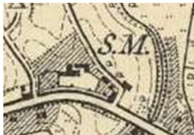
S.M. - Sägemühle (Schneidemühle)