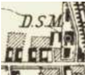
D.S.M. - Dampf-Säge-Mühle