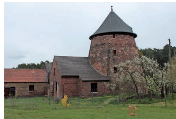
↑ Die Sielower Mühle, ↓ an der Sprewehrmühle