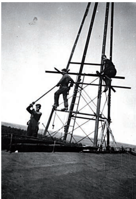
ca.1918 Aufbau der Windturbine auf die neu erbaute Mühle durch die Stahlbaufirma Schmidt und Dietrich aus Frankfurt (Oder)