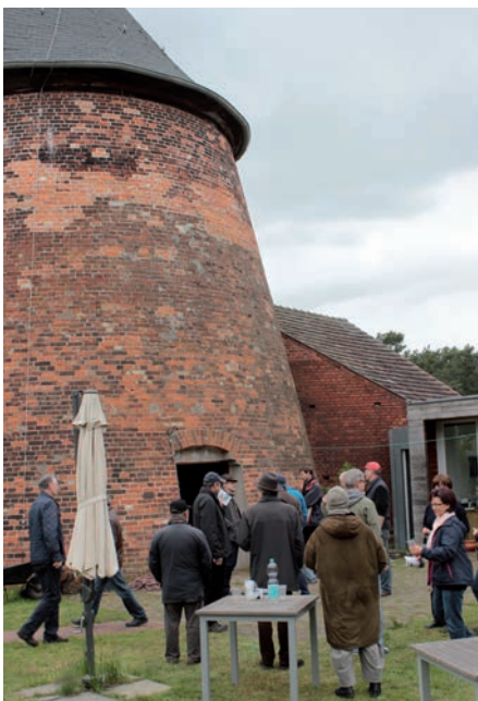
Mitgliederversammlung 2016: An der Sielower Mühle im Gespräch