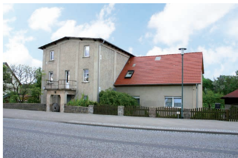
Die Mühle heute