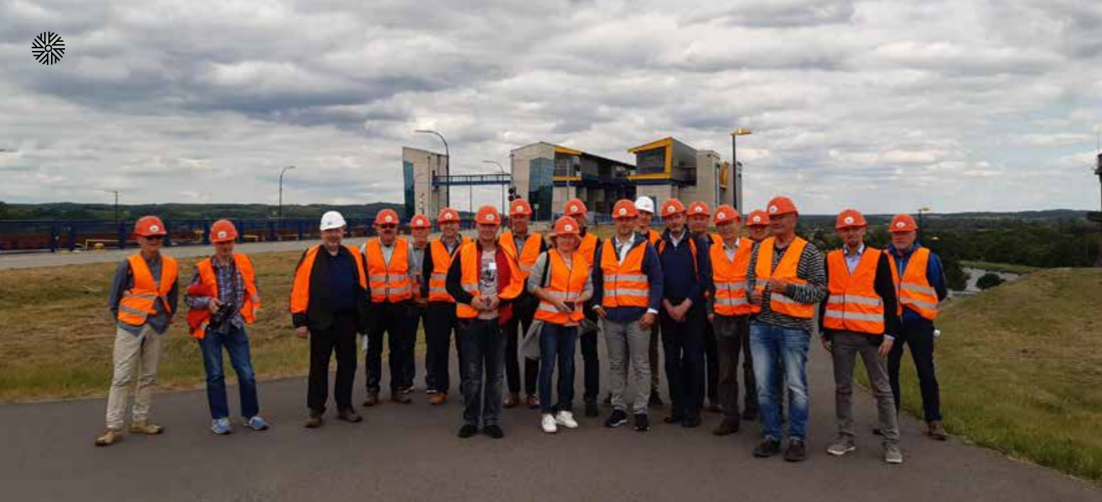
Teilnehmende der Fachveranstaltung bei der Besichtigungstour, Schiffshebewerk Niederfinow