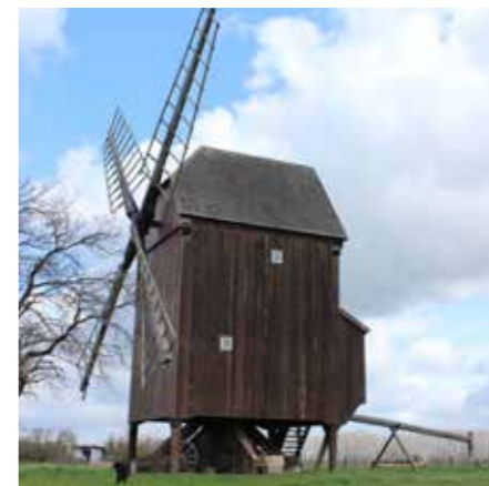
geschädigte Bockschwelle der Bockwindmühle Altbelgern