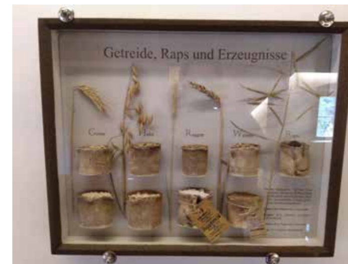
Schautafel und Ausstellungsstücke in der Zainhammer Mühle Eberswalde

den Mühlennachrichten vom Dezember 2021 veröffentlicht wurde, die allen Mitgliedern zugegangen sind. Es wird einstimmig angenommen. Auf eine Verlesung wird nach Rückfrage verzichtet.