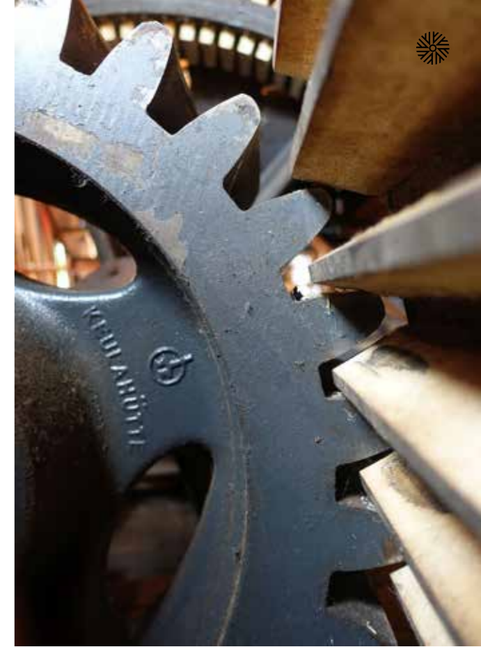
Gussritzel 1993 bis 2021