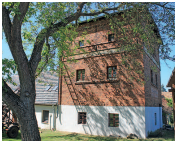
Paltockmühle Seifertshain (li.), Motormühle Paffendorf (re.)