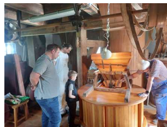
Infostand der Mühlenvereinigung/Historische Mühle und dem Jan-Bouman-Haus auf dem Kulturerbefest (li.), am restaurierten Mahlgang in der Großkopfs Turmholländermühle Niemege (o.)