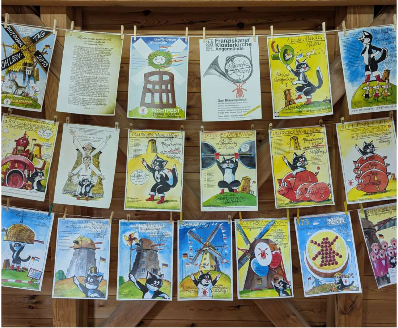
Sammlung von Werbeplakaten für die Greiffenberger Mühle, ausgestellt in der Erdholländermühle