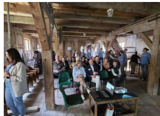
Papiermühle in Barlinek, rechts: Mühlenakteure der Via aus Polen und Deutschland