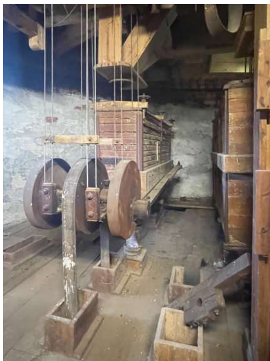
Böden in der Turmholländermühle, rechts der hängende Flachsichter Foto unten: Walzenstühle auf dem Mahlboden

Vielmehr ging es darum, das Objekt als vielschichtiges materielles Zeugnis seiner eigenen Geschichte in möglichst authentischem Zustand zu bewahren und seine Bedeutung zu vermitteln.